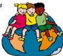
We horen bij elkaar