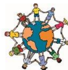
We zijn allemaal anders