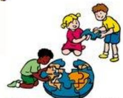
We dragen allemaal een steentje bij