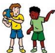
We lossen conflicten zelf op