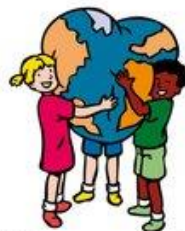
We hebben hart voor elkaar