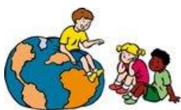
We hebben oor voor elkaar